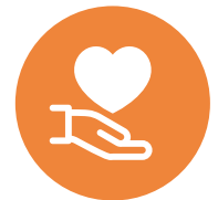
公衆衛生・社会福祉

Foxitは国際標準規格ISO32000-1に準拠した再現性と軽快な動作を誇るPDFリーダーと高性能なPDF作成・編集ソフトの両方を同時にご提供できるAdobeと並ぶPDF業界のリーディングカンパニーです。